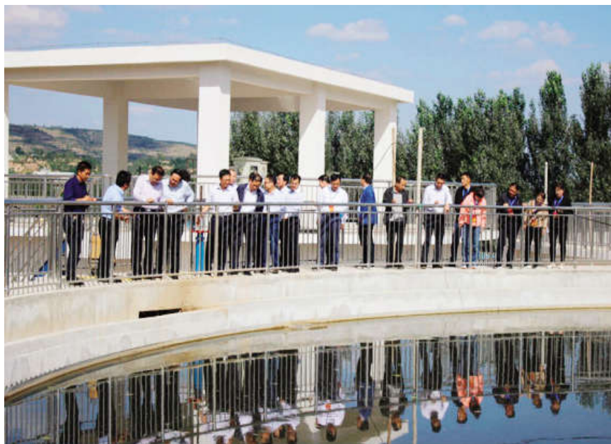
2019年7月11日,对全县《中华人民共和国环境保护法》贯彻实施情况进行执法检查。图为执法检查组现场查看城区污水处理厂提标扩容改造工程。

质量有效监测天数 325 天,优良天数 282 天,达标率 86.8%,剔除沙尘影响后,PM10 平均浓度值为 73 微克每立方米,较 2018 年下降 11.0%,PM2.5 平均浓度值为 41 微克每立方米,较 2018 年下降 4.7%,污染物浓度均呈下降局势,区域环境质量得到明显改善;全县城镇集中式生活饮用水水源地水质各项监测指标均达到地下水水质标准Ⅲ类水质标准,达标率 100%。”2020 年 2 月 27 日,县十八届人大常委会第三十次会议听取和审议了《县政府关于 2019 年全县环境状况 and 环境保护目标完成情况的报告》。报告指出,取得成绩的同时,也存在环保政策法规宣传不够到位、环境质量改善任务依然艰巨、环境执法监管能力有待提升等问题,报告明确,下一步,泾川县