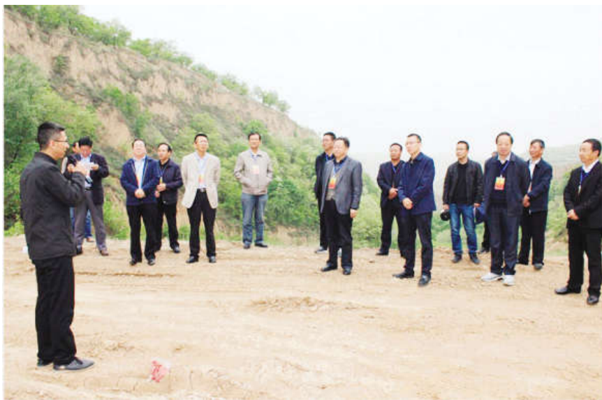
2019年5月14日,泾川人大常委会专题调研全县农村人居环境整治工作。图为调研组现场查看党原镇污水处理站和垃圾填埋场项目。

生态环境事关人民群众的生活质量和身体健康,拥有干净的水、清新的空气、安全的食品、优美的环境,是人民群众最朴实、最基本的期盼,也是人大常委会关注的重中之重。近年来,泾川人大常委会深入贯彻习近平生态文明思想,全面落实党中央和省、市、县委决策部署,坚持以人民为中心的发展思想,从“打赢污染防治攻坚