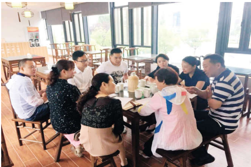
嘉定区人大代表在一设在茶馆的代表联系点听取人民群众意见建议。