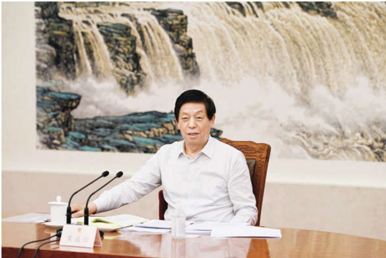
6月9日,中共中央政治局常委、全国人大常委会委员长栗战书在北京同列席十三届全国人大常委会第二十九次会议的全国人大代表座谈交流。