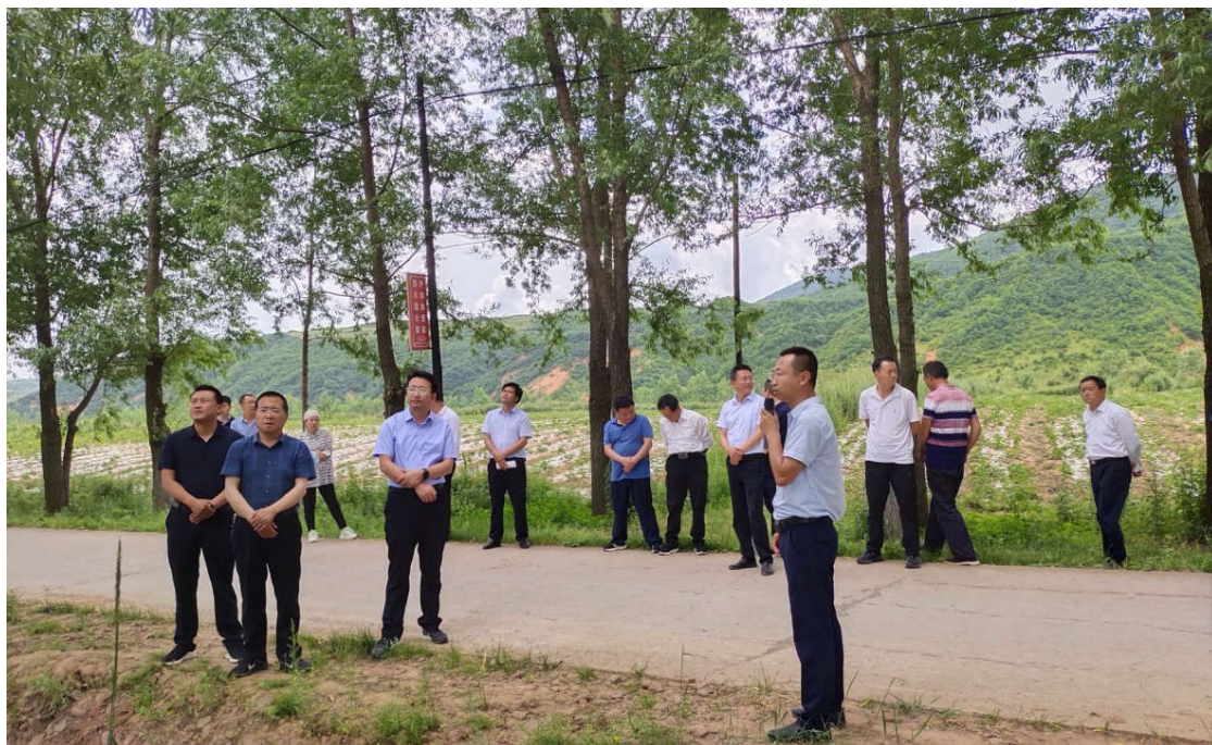
华亭市人大调研乡镇全域无垃圾工作

近年来,华亭市人大常委会积极发挥监督职能,坚持问题导向、目标导向、结果导向,创新监督方式,增强监督实效,以实际行动践行习近平总书记“绿水青山就是金山银山”思想,聚焦重点环节打好监督组合拳,倾力守护天蓝水绿的美好家园。