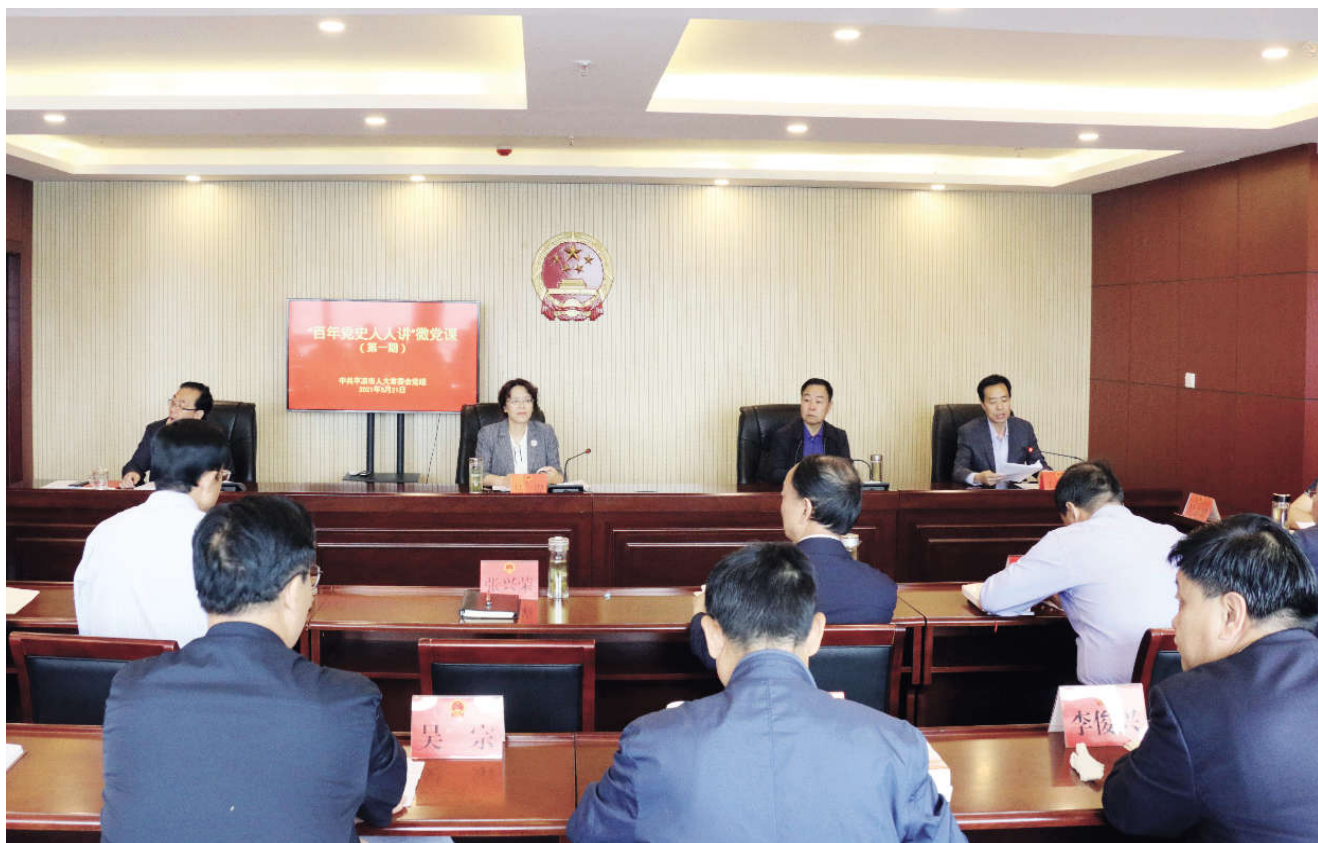
市人大常委会机关“百年党史人人讲”微党课