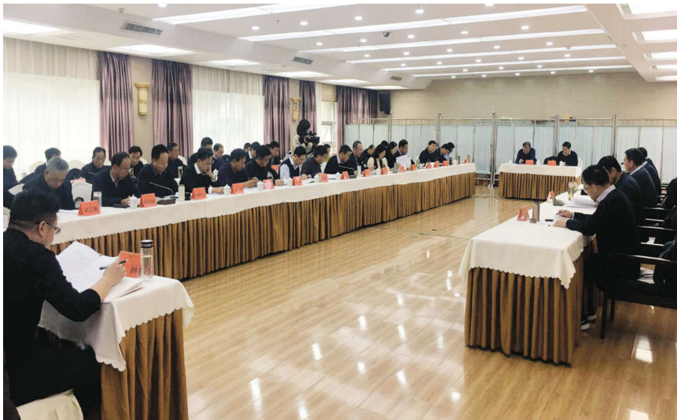
市人大召开财经委会议审查财政决算

近年来,甘肃省平凉市人大常委会财经预算工委坚持以习近平新时代中国特色社会主义思想为指导,在市人大常委会的坚强领导下,围绕推动全市经济社会高质量发展,聚焦财经监督工作重点,积极创新工作方式,加大工作力度,提升监督质量,持续推动财经监督工作走深走实。