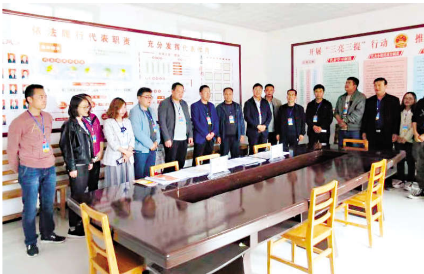
2019年10月,静宁县城川镇人大组织代表视察全镇“人大代表之家”运行情况。图为代表在吴庙村“人大代表之家”听取相关工作情况介绍。

积极创造条件,采取以会代训等形式,加强对人民代表大会制度理论和组织法、代表法等与代表工作相关法律法规的学习培训,提高人大代表对人民代表大会制度、人大工作性质和特点、人大代表职权的认识。通过学习,不断强化代表政治意识、职务意识和责任意识,明确如何在法定范围和界限内履