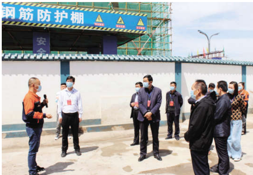
2021年5月27日，检查全县《中华人民共和国固体废物污染环境防治法》实施情况及环境状况和环境保护目标完成情况。图为检查组现场查看城区餐厨垃圾处理站建设情况。

市人大常委会高度重视和加强代表在生态文明建设方面的意见建议的跟踪督办，一抓到底，直到问题解决，着力提高办理实效。比如，2020年1月县十八届人大五次会议期间，24名代表联名提出“关于加大城乡人居环境整治扶持力度的建议”，市人大常委会组织组成人员和相关部门负责同志通过外出考察学习、实地调研、征求意见、召开代表座谈会等多种形式，督促县政府及其承办部门把开展农村人居环境整治作为实施乡村振兴战略的第一场硬仗，以创建24个改厕示范村为抓手，采取统